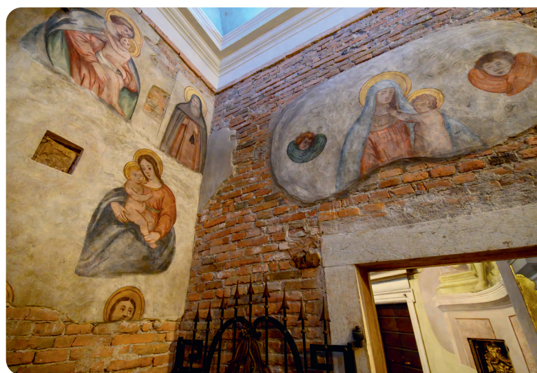
Interno del Santuario di Loreto: i visitatori entrano nella Santa Casa della Madonna.

DENTRO IL SANTUARIO DI LORETO C'È LA SANTA CASA. LA SANTA CASA È LA CASA IN CUI MARIA VIVEVA CON GESÙ. LA TRADIZIONE RACCONTA CHE GLI ANGELI HANNO PORTATO LA CASA DA NAZARET A LORETO.