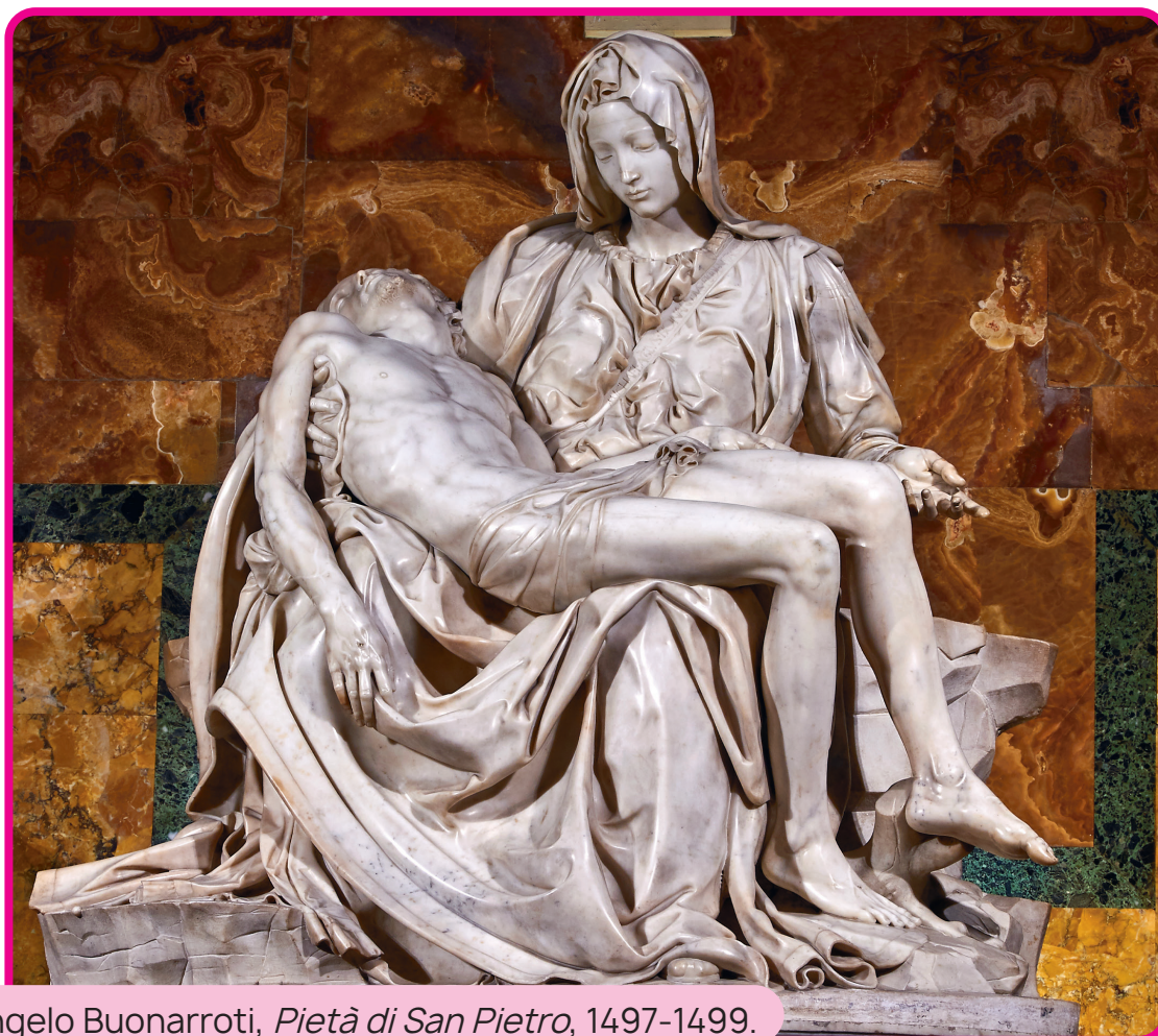
Michelangelo Buonarroti, Pietà di San Pietro , 1497-1499.