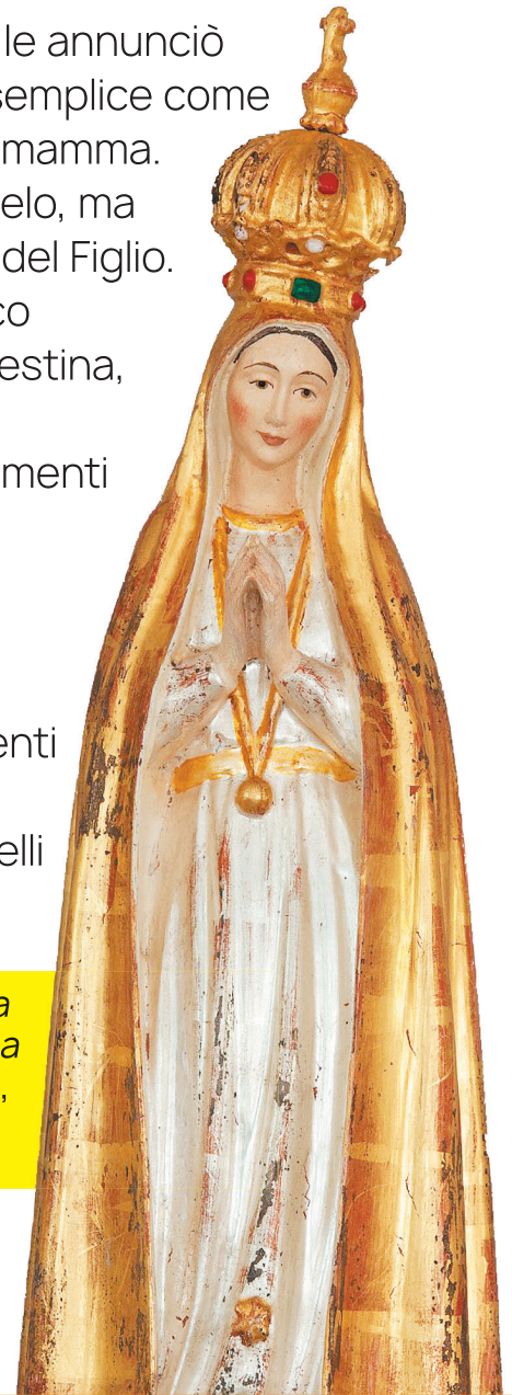
Madonna pellegrina di Fatima, statua in legno.

Esistono molti santuari dedicati a Maria. Alcuni, come quelli di Lourdes e di Fatima, sorgono in luoghi particolari in cui la Madonna è apparsa a dei fanciulli, invitando, tramite loro, tutti i cristiani alla preghiera e all'amore fraterno. I credenti, avvicinandosi in pellegrinaggio a questi luoghi, sentono particolarmente viva la presenza della Madre: per questo si rivolgono a lei con preghiere e chiedono il Suo aiuto per vivere con più coerenza la vita cristiana.